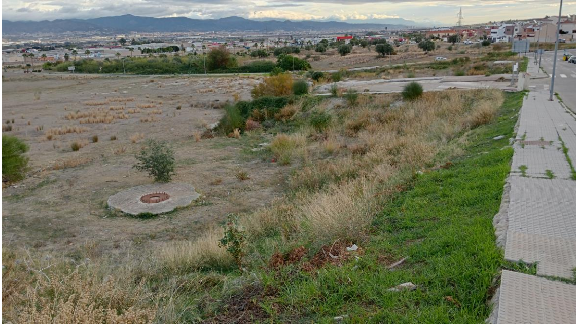
Parcela Oeste desde la calle Almena (S)

Desde este punto se asciende por una ladera con una mayor inclinación que nos lleva hasta la cima existente en el sector Oeste de la parcela. Es aquí durante este ascenso, por su lado Norte, donde localizamos algunos fragmentos cerámicos de cronología romana, tegulae principalmente.