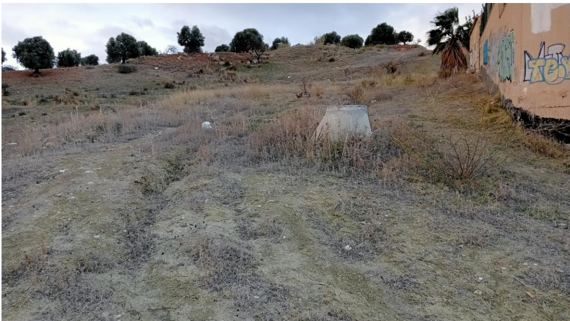
Ladera de la Parcela Oeste (N) con materiales cerámicos