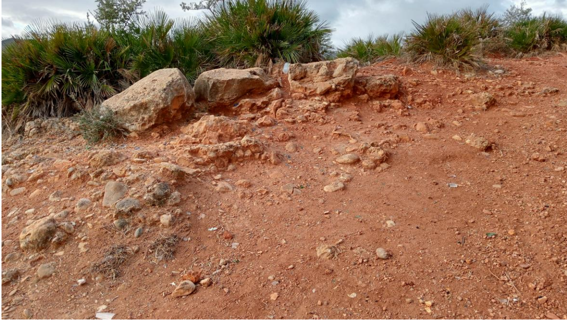
Afloramiento rocoso en la cima de la Parcela Oeste

Hacia el extremo Oeste de la parcela el terreno, cubierto de arbustos, va cayendo hacia una zona urbanizada con viviendas. No hay indicios arqueológicos en superficie.