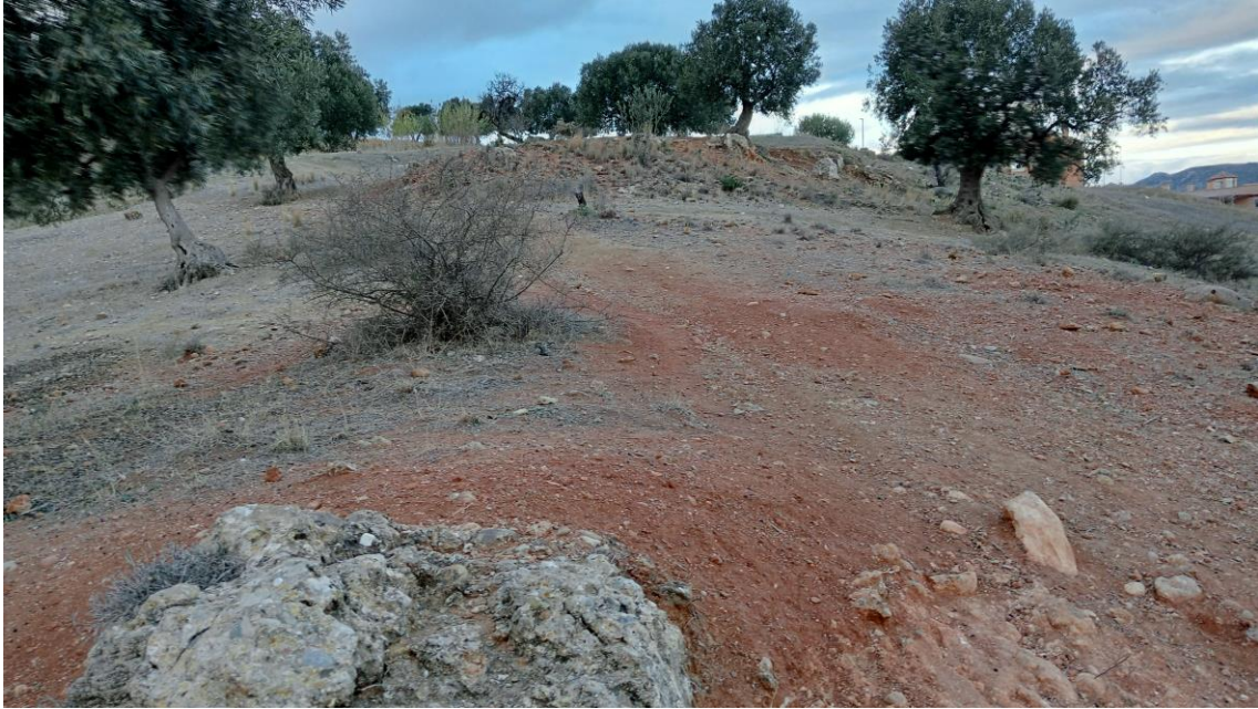
Olivar en la ladera de la Parcela Oeste