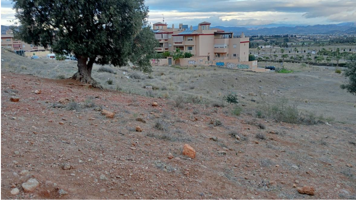
Ladera de la Parcela Oeste vista desde el Sur