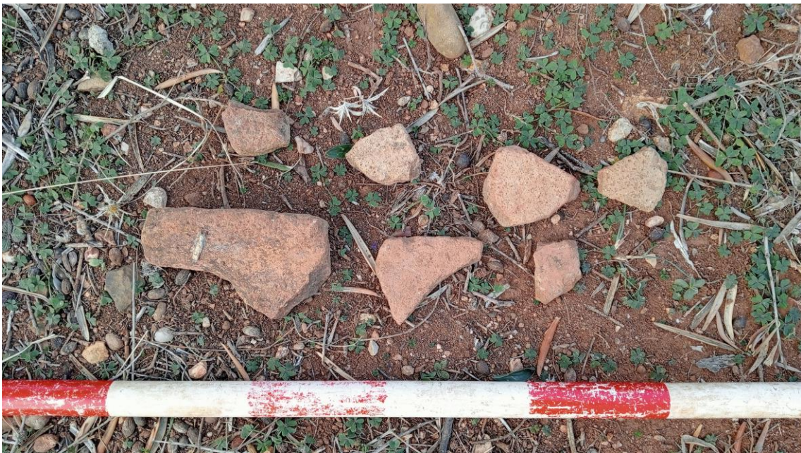
Materiales cerámicos en la Parcela Oeste