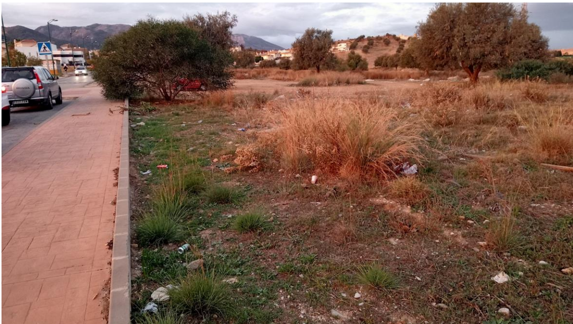
Parcela Este desde el SE (camino Angostura de la Capellanía)

La visibilidad de la superficie de la parcela es buena, no observando indicio arqueológico alguno, tan solo algunos escombros recientes.