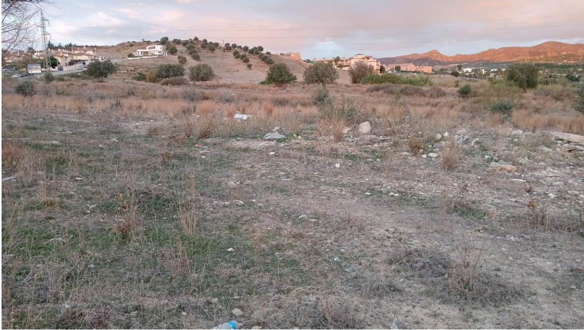
Parcela Este con el cerro al fondo

En el centro de la parcela existe una alberca contemporánea de mampostería, que se encuentra abandonada y semiderruida, sin mayor interés.