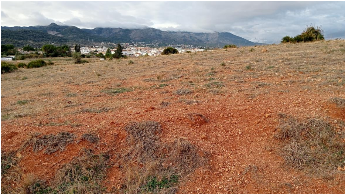
Sector Oeste de la Parcela Oeste con la Sierra de Mijas al fondo

Hacia el extremo Oeste de la parcela el terreno, cubierto de arbustos, va cayendo hacia una zona urbanizada con viviendas. No hay indicios arqueológicos en superficie.