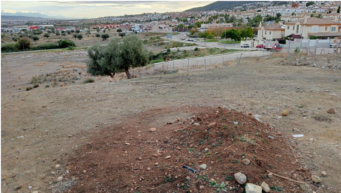
Sector Sur de la cima de la Parcela Oeste