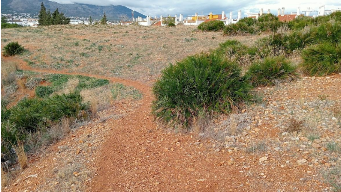
Límite del sector Oeste de la Parcela Oeste