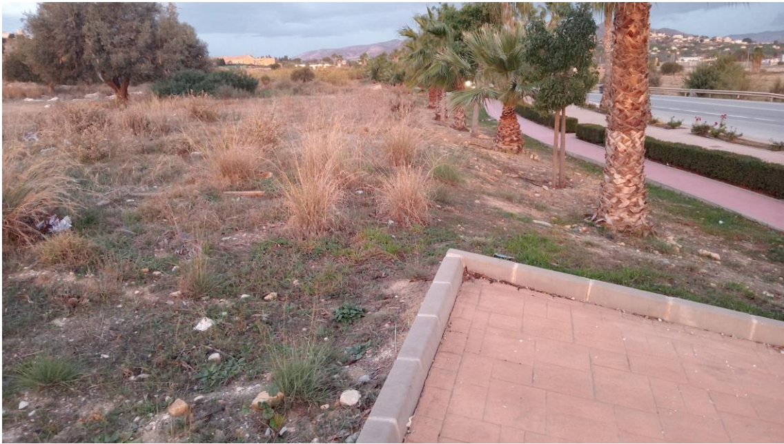
Parcela Este desde el SE (carretera de Coín)