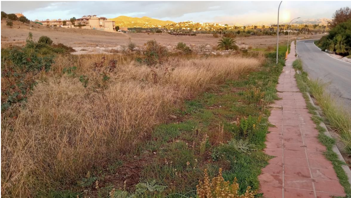
Parcela Oeste desde el SE (avenida Pau Casals)

Comenzamos la prospección desde la parte baja, desde la avenida Pau Casals, donde existe una vegetación arbustiva baja. La visibilidad del terreno es aceptable y no observamos indicio arqueológico alguno, a excepción de algún ladrillo reciente.