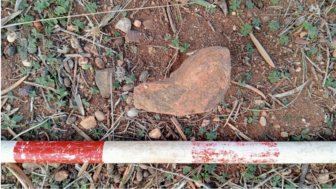
Detalle de una tegula en la Parcela Oeste

En la propia ladera existe una estructura de hormigón contemporáneo abandonada.