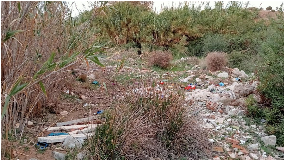
Escombros en el arroyo de Zambrana

El límite de la parcela hacia el Oeste es el cauce del arroyo de Zambrana, donde existe una vegetación de cañaveral y arbustiva, y en el cual encontramos numerosos escombros. No observamos indicio arqueológico alguno.