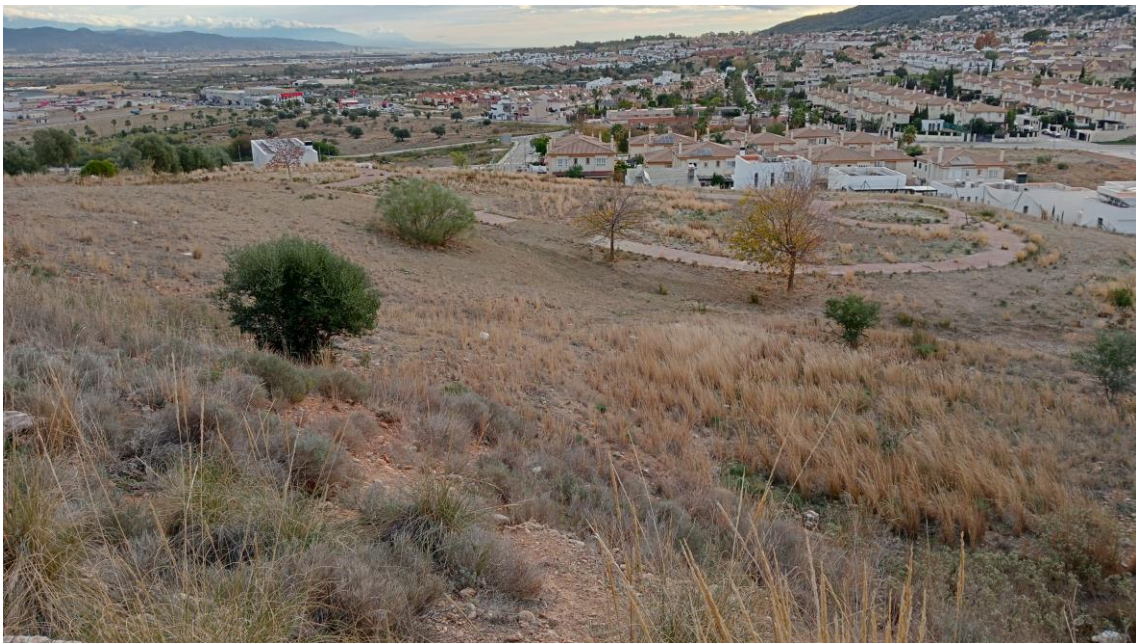
Sector Oeste de la Parcela Oeste con Alhaurín de la Torre al fondo