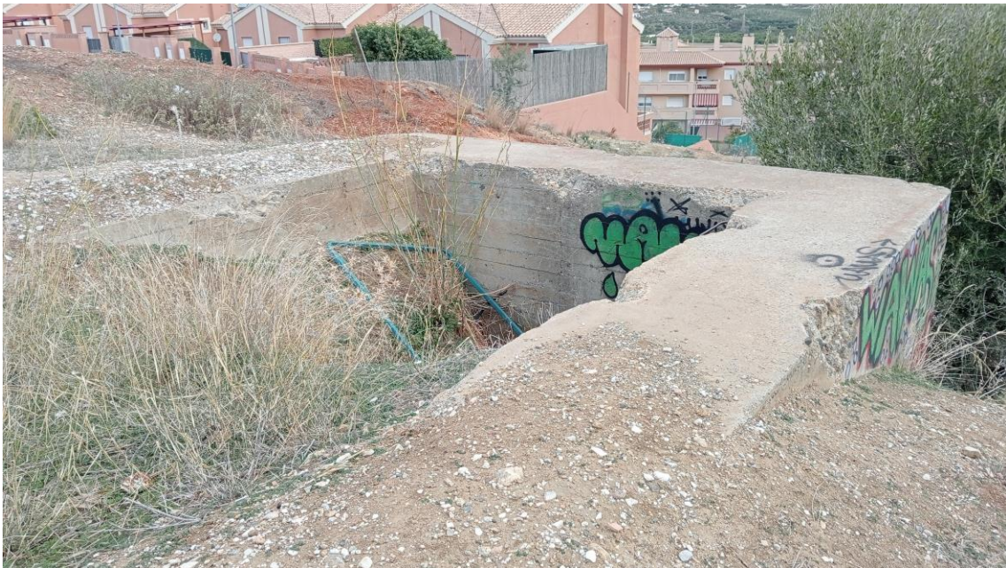
Estructura de hormigón en la Parcela Oeste

En la propia ladera existe una estructura de hormigón contemporáneo abandonada.