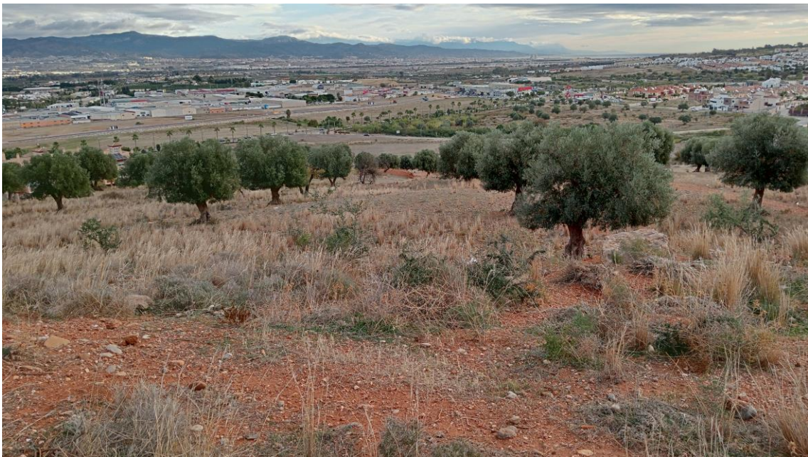
Cima de la Parcela Oeste con Málaga al fondo

En algunos puntos muy concretos afloran pequeñas rocas calizas del terreno, sin mayor interés.