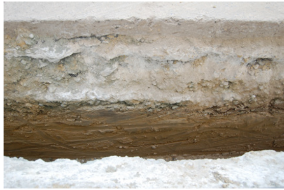
*Plaza del Carmen.