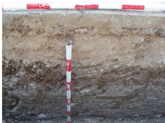
*Urbanización Santa Catalina VI.