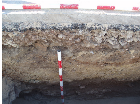
*Urbanización Nueva Andalucía III.