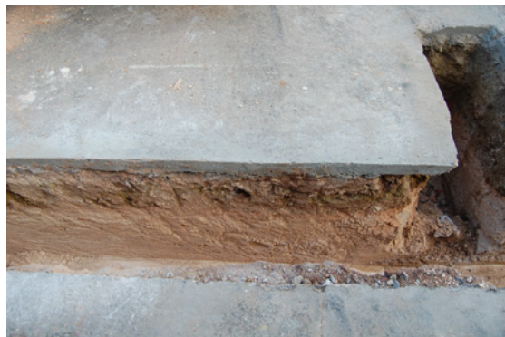
*Urbanización Santa Catalina II.