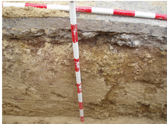
*Urbanización Santa Catalina IV.