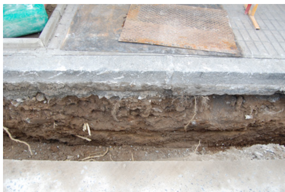
*Avenida Infante Don Fernando.