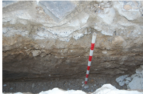
*Calle de los Claveles.