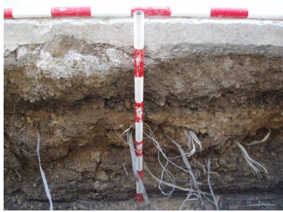
*Plaza Fernández Viagas-San Francisco.