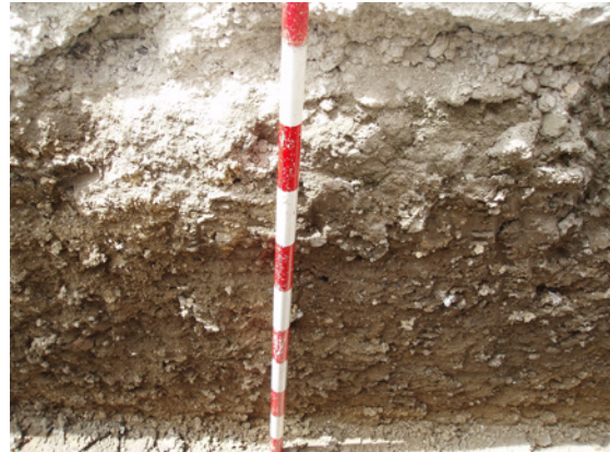
*Urbanización El Tejar.