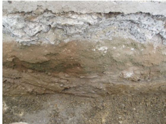
*Calle Escultor Diego Márquez.