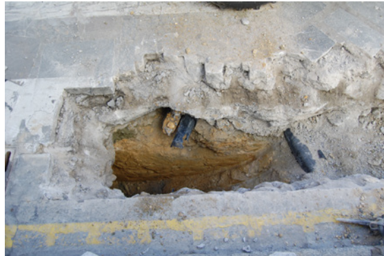
*Urbanización Santa Catalina I.