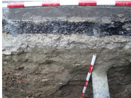
*Plaza Fernández Viagas I.