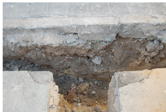
*Avenida de la Legión.