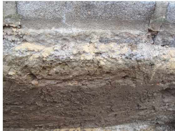
*Callejón de los Urbina.