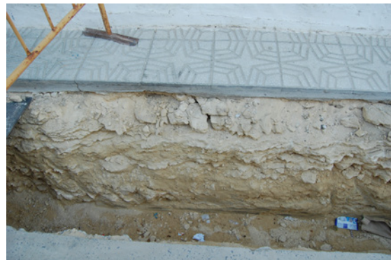
*Calle Cristo de los Avisos.