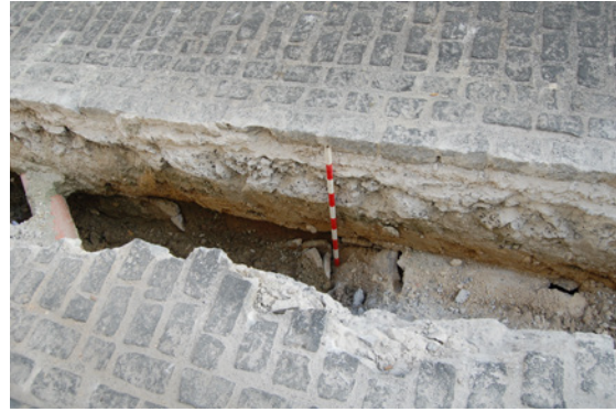
*Cuesta de los Rojas.