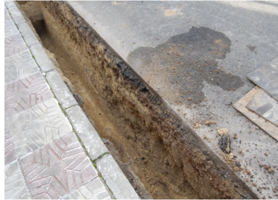
*Urbanización Nueva Andalucía II.