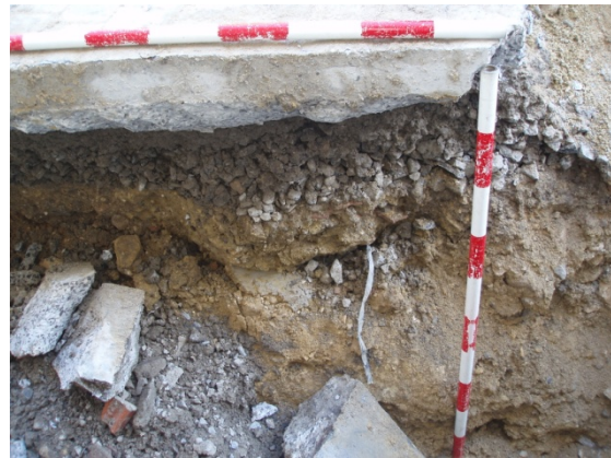
*Plaza Fernández Viagas II.