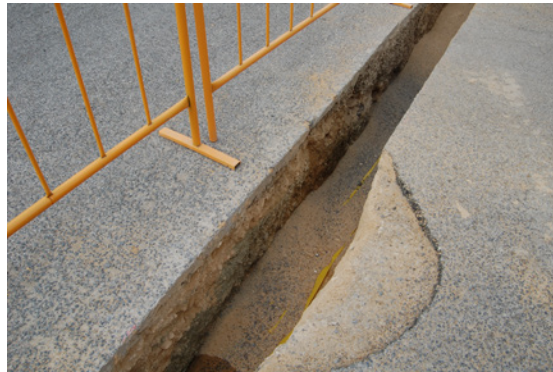
* Plaza de San Bartolomé.