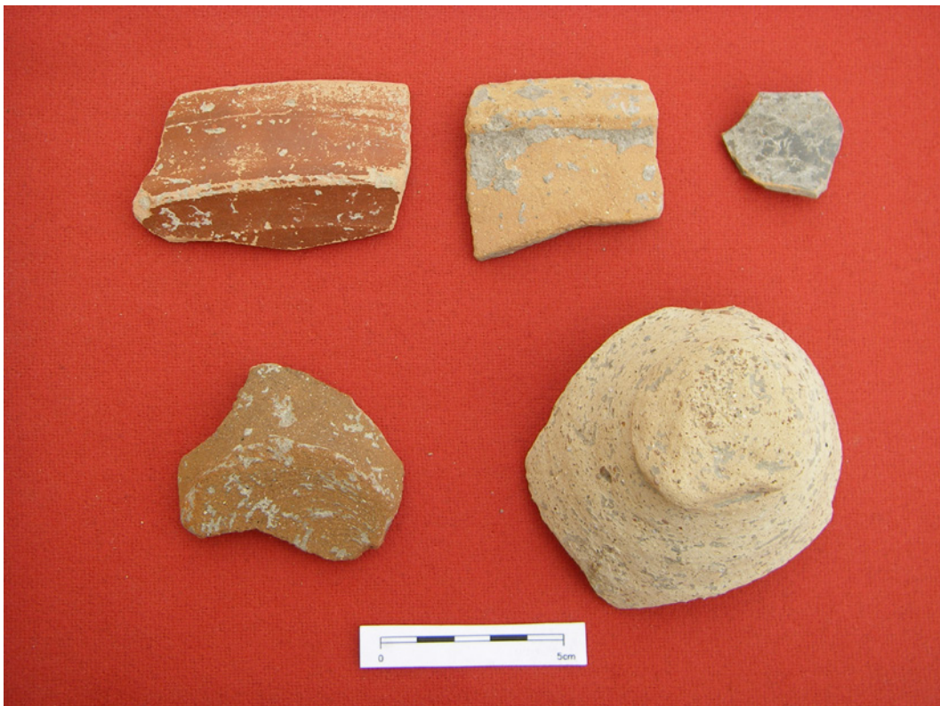
Fotografías 40: Materiales de la zanja de La Necrópolis de la Quinta.