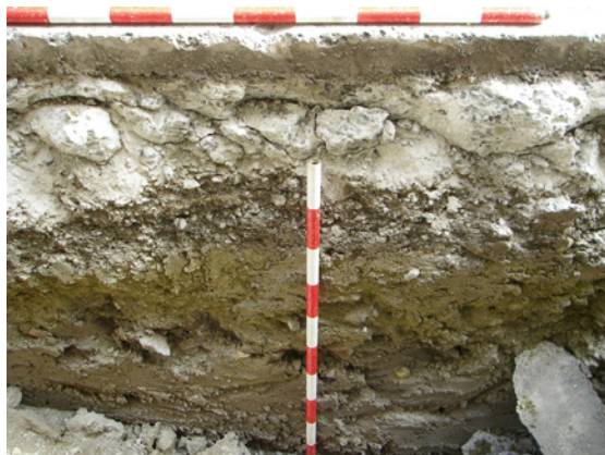
* Calle Calzada.