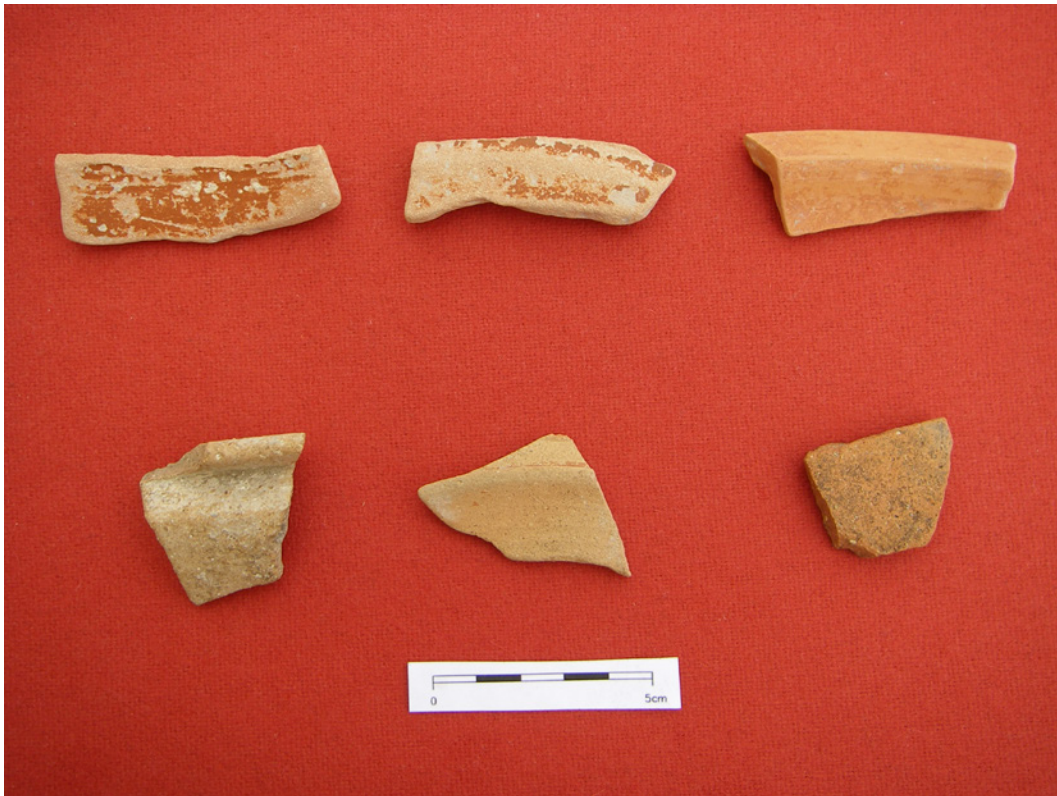
Fotografía 39: Materiales de la zanja de La Necrópolis de la Quinta.