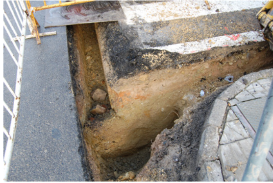
* Calle Pepe Berrocal.