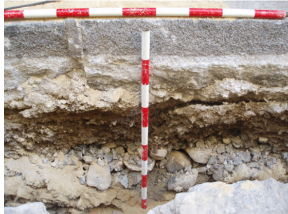
* Calle Cruz Blanca.