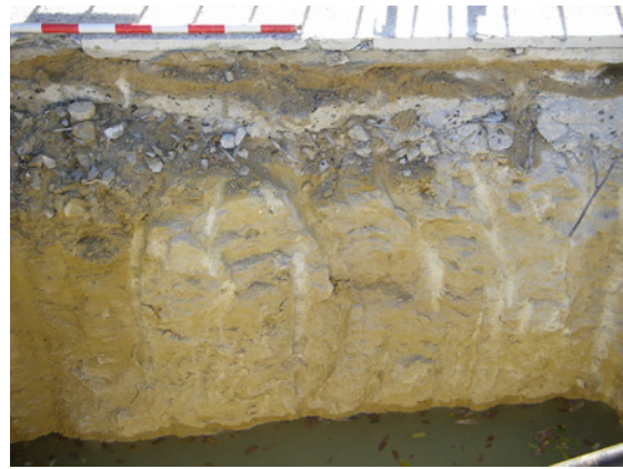
* Calle Ciudad de Agde.