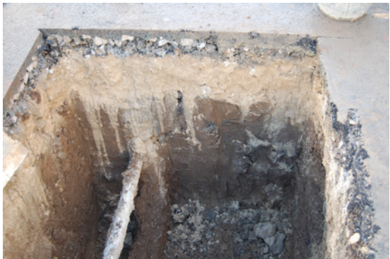
* Ronda Intermedia-Parquesol.