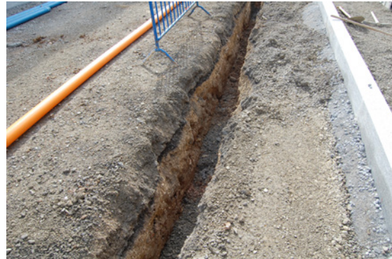
* Calle Huerta de Capuchinos.