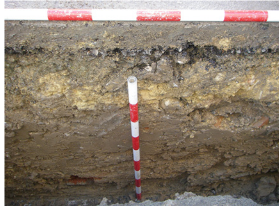
* Avenida de Miguel de Cervantes.