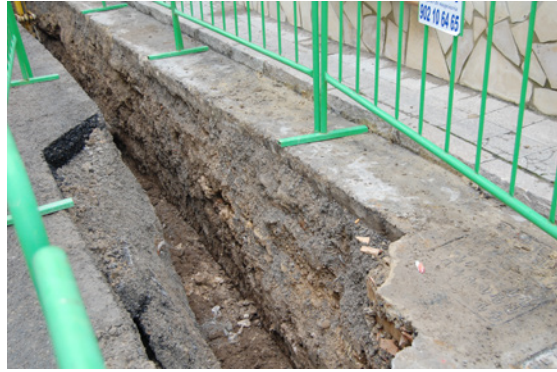
* Calle San Bartolomé.