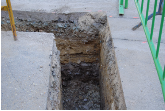
* Camino del Cementerio.