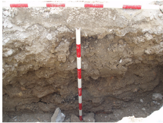
* Calle Infante Don Fernando.