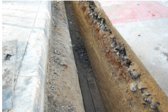
* Calle Francisco Garzón.