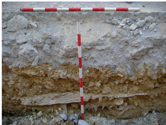
* Calle San José.