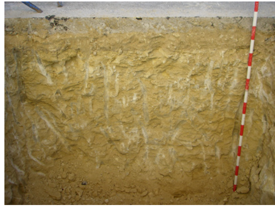
* Ronda Intermedia.