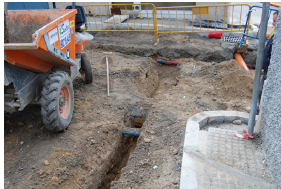
* Calle Camino de Gandía.