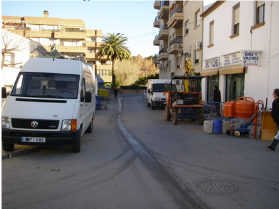
* Calle Rodrigo de Narváez.