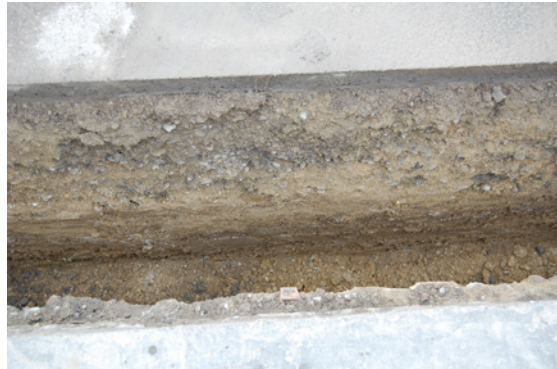
* Barrio de Nueva Antequera.