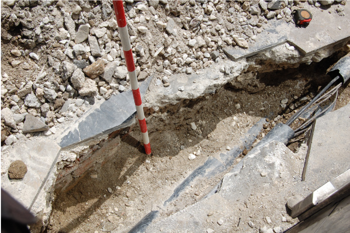
Lámina 3. Vista de la zanja y las tuberías.