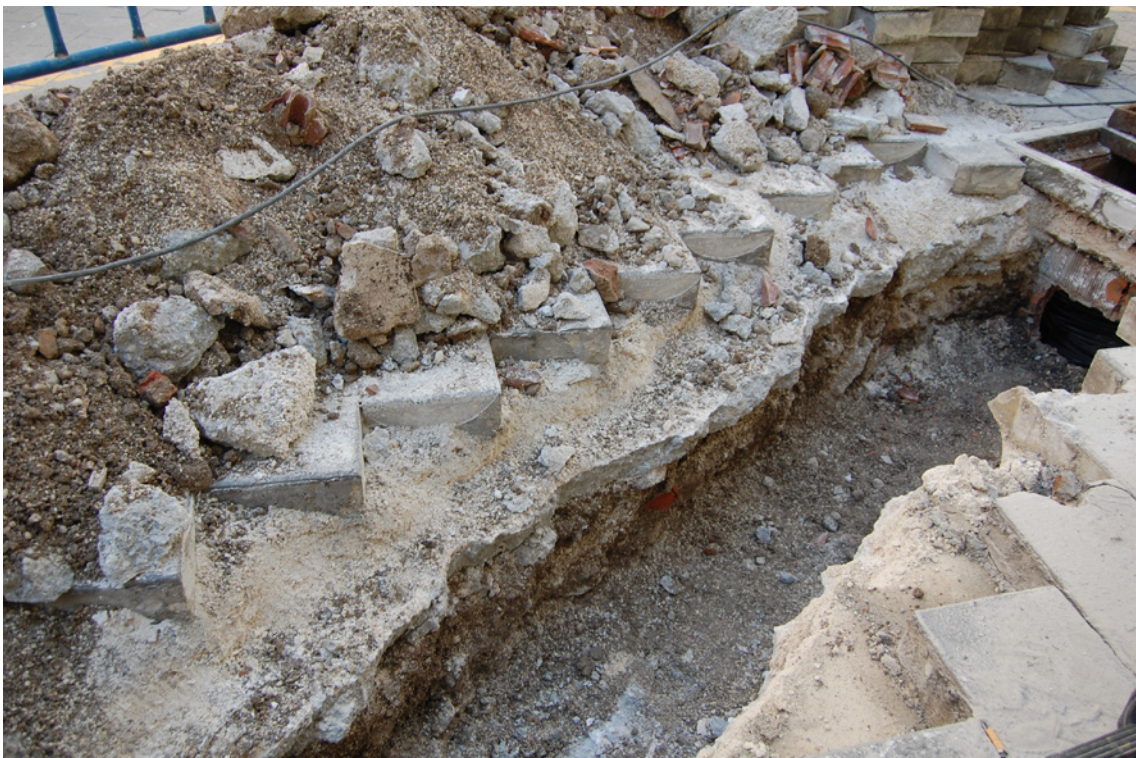
Lámina 4. Vista de la zanja y la arqueta.