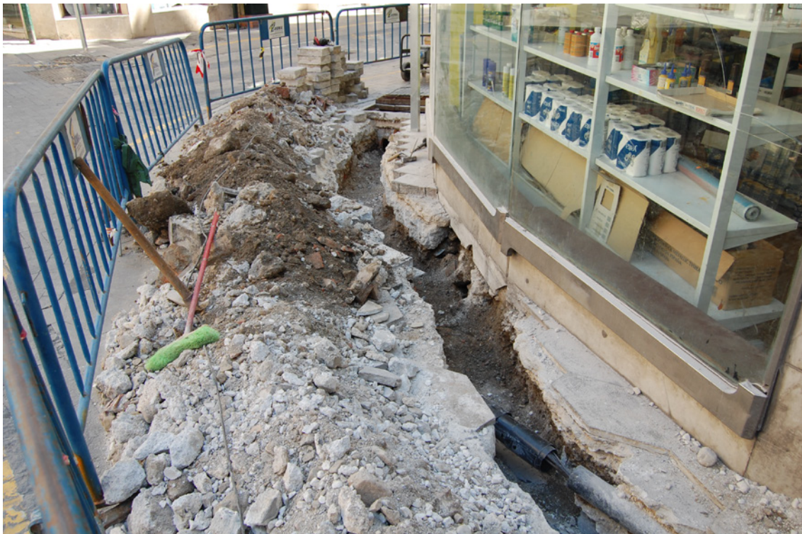
Lámina 2. Vista general de la zanja.